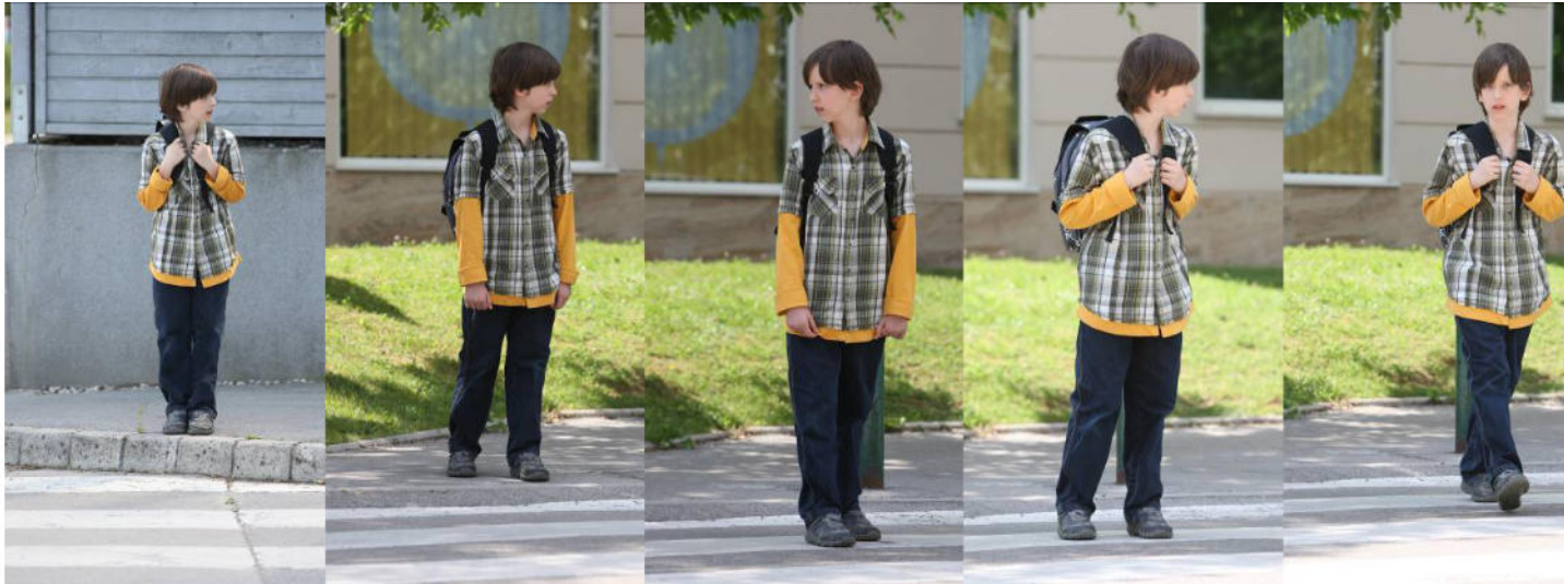
Se ustavim na robu